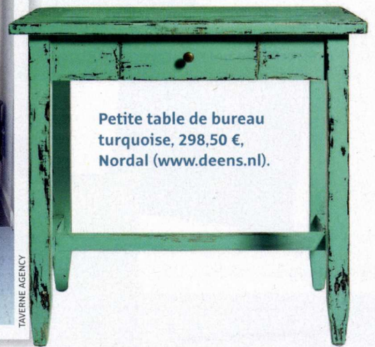
Petite table de bureau turquoise, 298,50 €, Nordal ( www.deens.nl ).