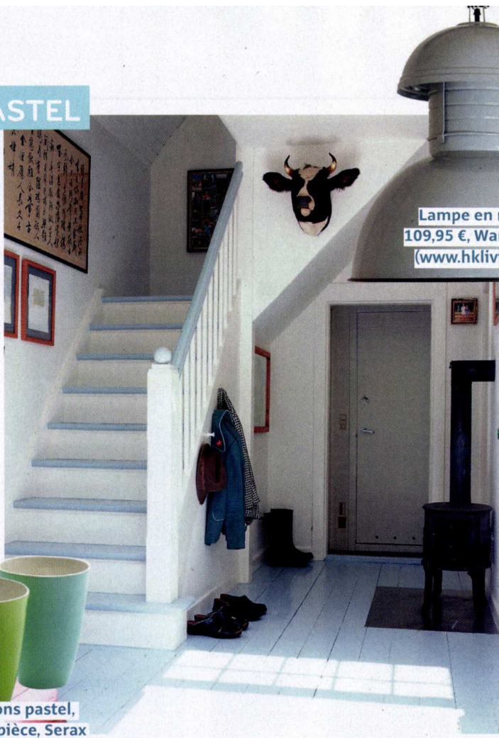
Lampe en métal, 109,95 €, Warehouse ( www.hkliving.nl ).