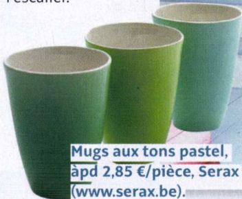
Mugs aux tons pastel, à pd 2,85 €/pièce, Serax ( www.serax.be ).

Pour apporter de la luminosité dans ce hall exigu, on a décidé de le peindre entièrement en blanc, y compris les boiseries (escalier et plancher). Mais on n'a pas utilisé un blanc neige, trop froid, ni un blanc crème, trop passe-partout. On a opté pour un blanc cassé de bleu. Un bleu plus accentué a ensuite été appliqué sur la rampe et les marches de l'escalier.