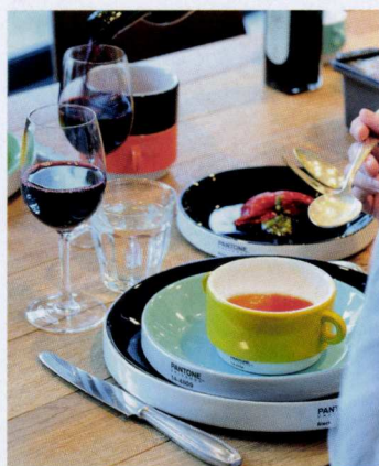
Pantone Pro Kitchen

Het retroservies is zowel thuis als in de horeca een eyecatcher. Het doet denken aan de gezellige cafetaria van weleer, met typische soepkommen met twee oren. In de uitgebreide reeks vindt u verder onder meer makkelijk te stapelen espresso-, ristretto- en koffietassen, onderbordjes, ontbijtborden en grote borden.