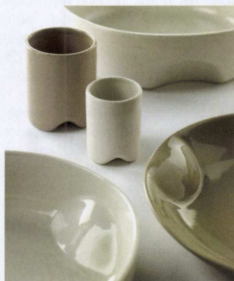
Bless Is More

bakster die heel aardse keramiek ontwerpt. 'Pure' doet oosters aan en wordt bijzonder positief onthaald.