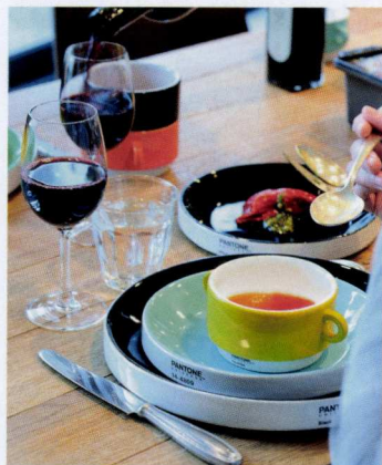
Pantone Pro Kitchen

Le service rétro attire l'attention à la maison comme dans l'horeca. Il évoque les agréables cafétérias d'antan, avec des bols typiques à deux anses. La série étendue englobe aussi entre autres des tasses à espresso, ristretto et café faciles à empiler, des soucoupes, des petites et des grandes assiettes.