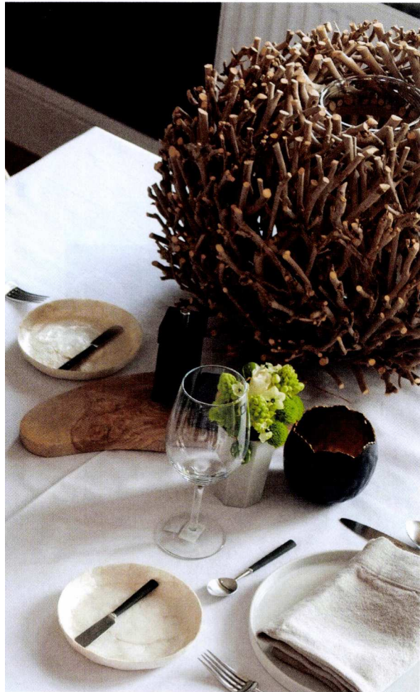
Tafellinnen van Flamant. "Ik houd van linnen, maar niet van kreuken, een tafelkleed moet glad zijn."

het vak. En eigenlijk is er niet zo heel veel veranderd. Toen stond er wel veel meer op tafel, drie wijnglazen, alle bestek. Nu brengen we onze gasten alles op tijd en stond." Ook wanneer het stel privé mensen ontvangt, dekt Sofie haar tafel tot in de puntjes. "Ik doe dat gewoon heel graag. Ik zou driemaal de hele schikking veranderen tot het precies goed zit. Eigenlijk breng ik gewoon dingen samen die ik zelf mooi vind. Ik houd van natuurtinten, natuurlijke materialen en van verse bloemen en ik maak ook heel graag bloemstukjes. Dus voorzie ik voor elke gast geregeld een klein bloementafereeltje. Een aandenken dat ze op het einde van de avond mee naar huis mogen nemen. Andere keren leg ik dan weer op elk servet een mooie, passende spreuk. Door telkens met een nieuw accent uit te pakken, eindig je altijd met een compleet andere tafel. En dat is de bedoeling."